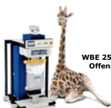
WBE 25/50 für Offensäcke